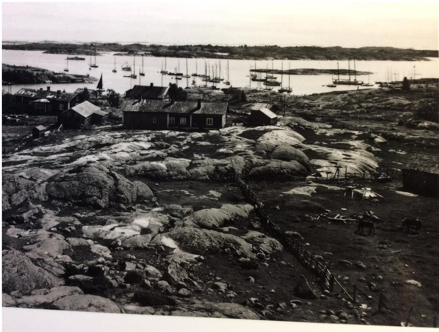
Vänö 1949.